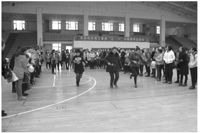
图为县直机关女干部参加趣味运动会。