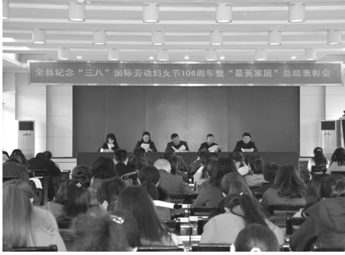
图为“最美家庭”总结表彰大会现场。