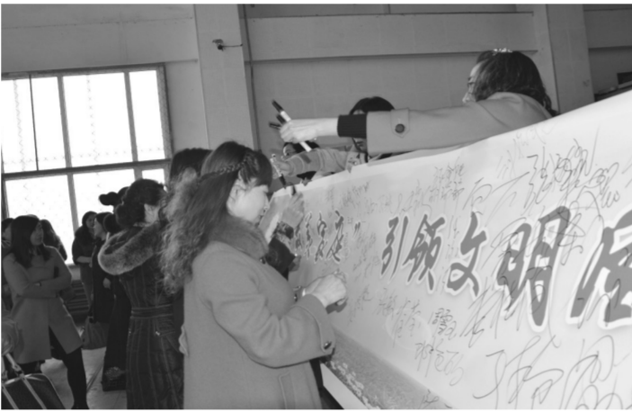
图为“最美家庭”主题签名活动现场。