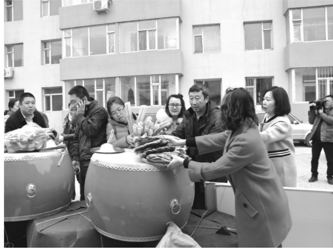
图为“妇女之家文化扶贫”活动现场。