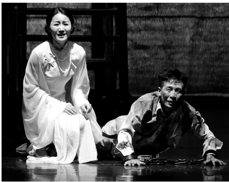
4月4日晚，由中宣部、教育部主办的原创大型史诗话剧《雨花台》在北京大学上演，让观众学子重温雨花英烈精神，也拉开该剧为期两年的全国高校百场巡演序幕。图为4月4日，演员在表演话剧《雨花台》。

记者了解到，汤墓原址在抚州市文昌里一带的汤家山上，是汤显祖与其原配夫人吴氏及继室夫人赵氏、傅氏的合葬墓。抚州市计划将汤墓原址与附近的玉隆万寿宫（抚州会馆）、文昌桥、正觉寺等建筑遗存，共同打造为独具地方特色的历史文化街区，改造项目已于2015年下半年启动。