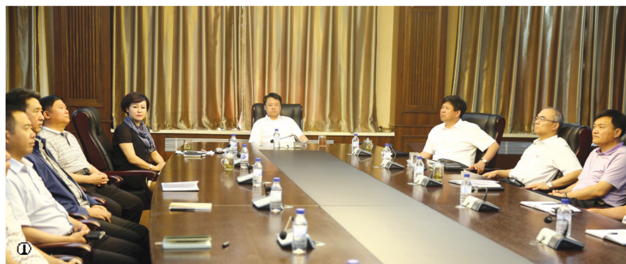
图①市领导与机关干部一同观看庆祝中国共产党成立95周年大会现场直播。 图②白城师范学院师生观看庆祝中国共产党成立95周年大会现场直播。 图③洮北区瑞光街道办事处新村社区组织社区干部代表、居民党员代表、驻街单位党员代表共同观看庆祝中国共产党成立95周年大会现场直播。

习近平指出,青年是祖国的未来、民族的希望,也是我们党的未来和希望。全党要关注青年、关心青年、关爱青年,倾听青年心声,做青年朋友的知心人、青年工作的热心人、青年群众的引路人。全国广大青年要深刻了解近代以来中国人民和中华民族不懈奋斗的光荣历史和伟大历程,坚定不移跟着中国共产党走,勇做走在时代前列的奋进者、开拓者,让青春在为祖国、为人民、为民族的奉献中焕发出绚丽光彩。(下转二版)