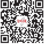
指尖白城 (白城日报社微信) bcrbwxx

本报公共电子邮箱: 2016年10月28日 星期五 农历丙申年九月廿八 第9940期 bcrbs0153@vip.163.com