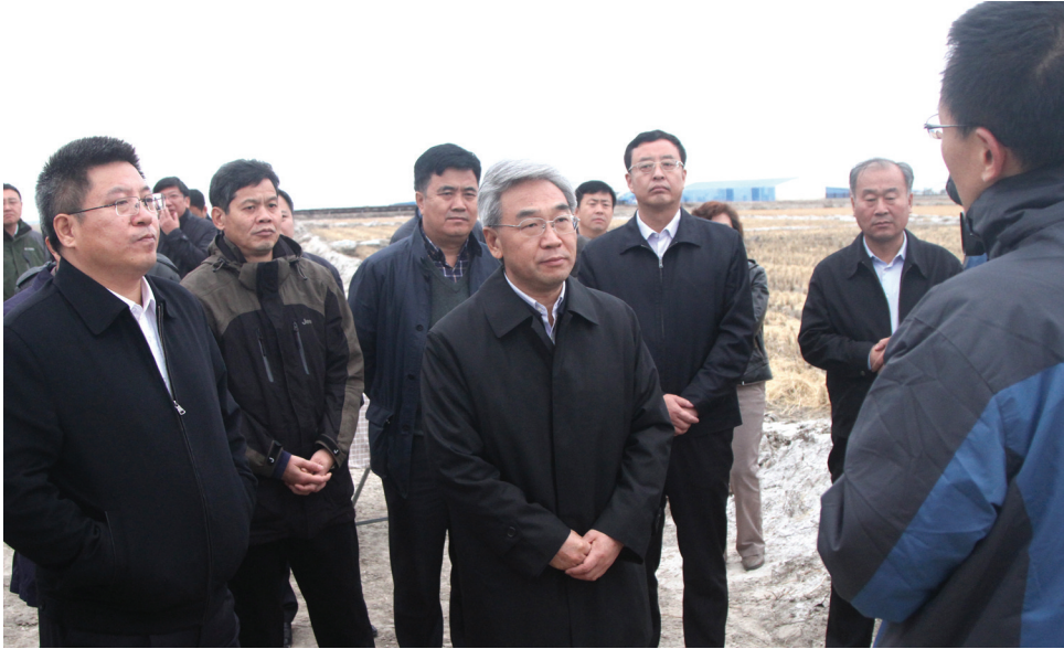
农业部副部长张桃林(中)到大安市联合乡兴业村调研盐碱地改造情况