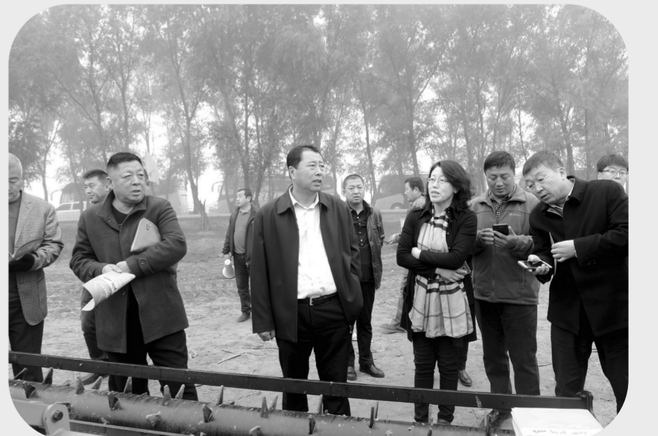
通榆县人民检察院预防网络监督平台与通榆县农机局联网开设了监督专线,可随时监测和调取深松整地作业情况。图为在通榆县召开的全省土地深松现场会,省、市、县检察院领导现场查看土地深松监控设备运行情况,并通过“流动检察室”对扶贫深松项目现场监督。信息化的监督预防手段,引起了与会者的浓厚兴趣,得到了省、市院领导和与会者的一致赞扬