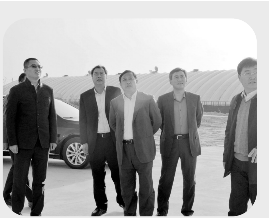
白城市委常委、通榆县委书记孙洪君,白城市人民检察院检察长李军在预防教育基地调研指导工作

通榆县农机深松整地作业补助项目实现信息化预防后,强化了国家土地深松补助资金监管,对易发生职务犯罪的关键环节做到了提前预警,防止了补助资金在发放过程中弄虚作假、滥用职权、或严重不作为、玩忽职守,导致资金被骗取、套取、挥霍等犯罪案件的发生,增强了项目从业人员的廉洁意识和职务犯罪预防意识。通榆县检察院重点站岗位监督,超前检察建议的创新模式,确保了项目优质、干部优秀和国家补贴资金安全。