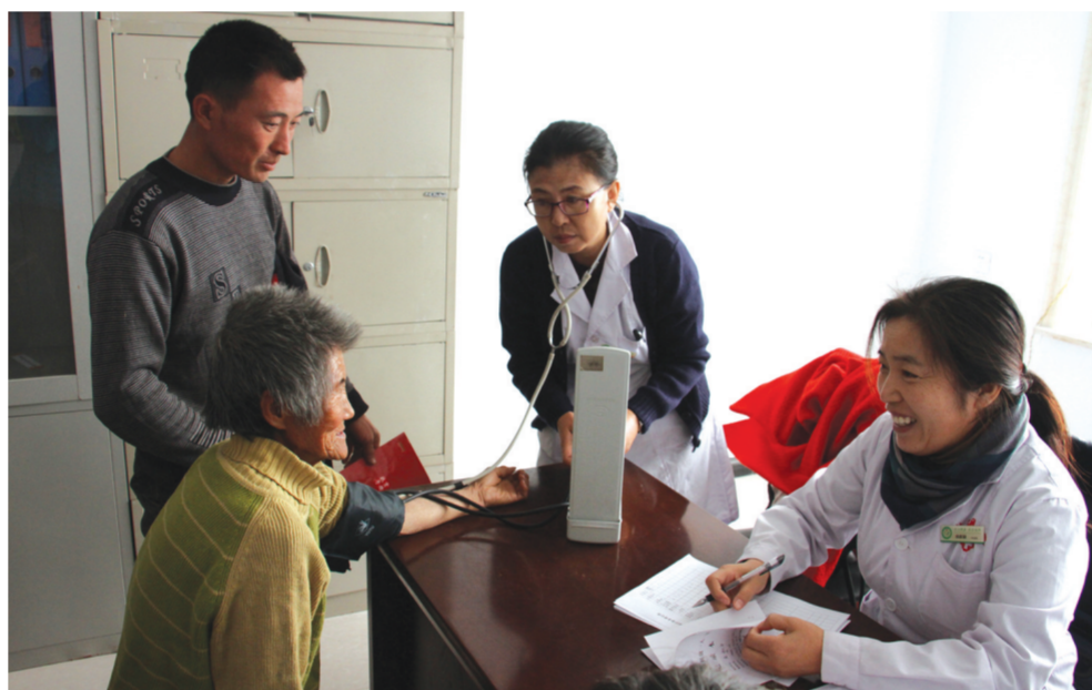
镇赉县近日组织医护人员45人组成三支医疗队,陆续深入各乡镇开展贫困人口巡回医疗救治活动。目前共诊治患者6051人,并全部登记造册签约治疗,免费发放药品价值1.3万余元。图为医护人员在五棵山镇且力木村为贫困村民查体

市委常委、市政府副市长李振仲,市中级人民法院代理院长周文君,市人民检察院检察长李军,市人大常委会各委负责人列席会议。