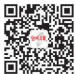
指尖白城 (白城日报微信) bcrbw

本报公共电子邮箱：bcrbs0153@vip.163.com 2016年11月30日 星期三 农历丙申年十一月初二 第9968期