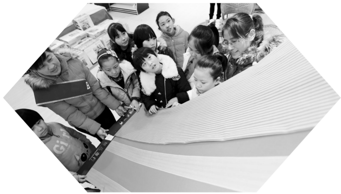
河北省衡水市冀州区开展“体验民俗 快乐寒假”社会实践活动。学生走进田园棉花文化园，近距离体验传统手织布工艺的纺线、经线、织布等工序，感受民俗文化的独特魅力，丰富寒假生活。图为学生在冀州区田园棉花文化园内参观手织布产品。