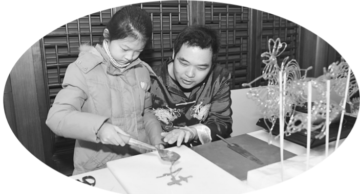
杭州市青少年活动中心的“Do·都城”少儿职业体验馆推出“金鸡报晓辞旧岁 福满庙会迎春来”新春特别活动。小朋友们不仅能够近距离观摩糖画、捏面人等传统手工艺展示，还可以参加写“福”字、舞龙表演、大巡游等活动，感受浓浓的年味。图为在杭州市青少年活动中心，小朋友在民间艺人的指导下洗糖画。