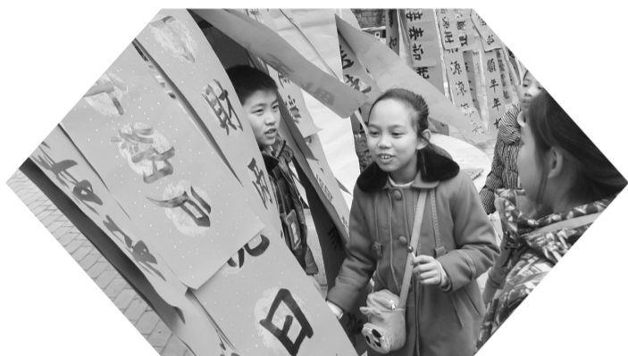
广西柳州市金绿洲小区一个书法培训班组织20多名小学生为市民书写春联，喜迎新春佳节。图为小学生在广西柳州市潭中西路一处小公园内交流书写的春联。

翻一翻五花八门的寒假作业，不论是要练就十八般武艺，还是读万卷书、行万里路，都是一本薄薄的账本。为了交上一本完美的作业，很多城市家庭都不惜重金。然而，孩子们对这些作业都“买账”吗？