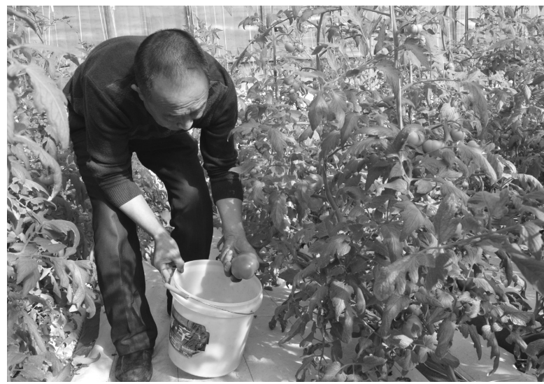
作为扶贫项目,德顺蒙古族乡四家子村投资近500万元,建造了10栋高标准双膜双被保温大棚,引进水肥循环系统,采用无土栽培技术,生产无公害绿色食品。