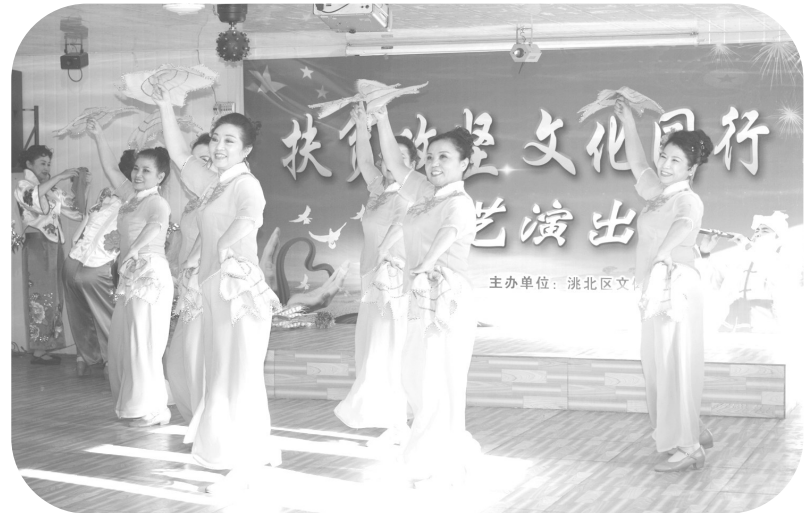
洮北区把文化惠民摆在突出位置,将党和国家惠民政策和人文关怀,通过“送演出下基层”的活动形式,让贫困群众真正享受到“文化民生”带来的幸福生活,在实现物质脱贫的同时实现精神脱贫。