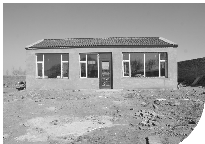
洮北区将农村危房改造作为改善群众住房、助推脱贫攻坚的重要民心工程,强力推进、有序进行。图为即将改造完成的贫困户住房。