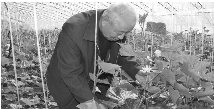
青山镇红星村扶贫产业园内“小黄瓜”长势喜人。