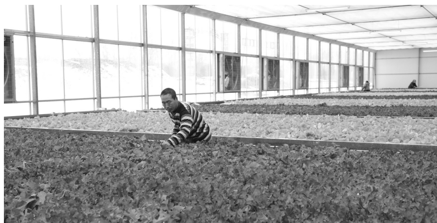
洮北区林海镇一农场智能玻璃温室,分为番茄、黄瓜、草莓、都市农业4个区域,采用全自动智能控制系统和水肥一体化无土栽培技术,实现了科学化种植、数字化管理,为引导产业脱贫起到了良好的示范和带动效应。