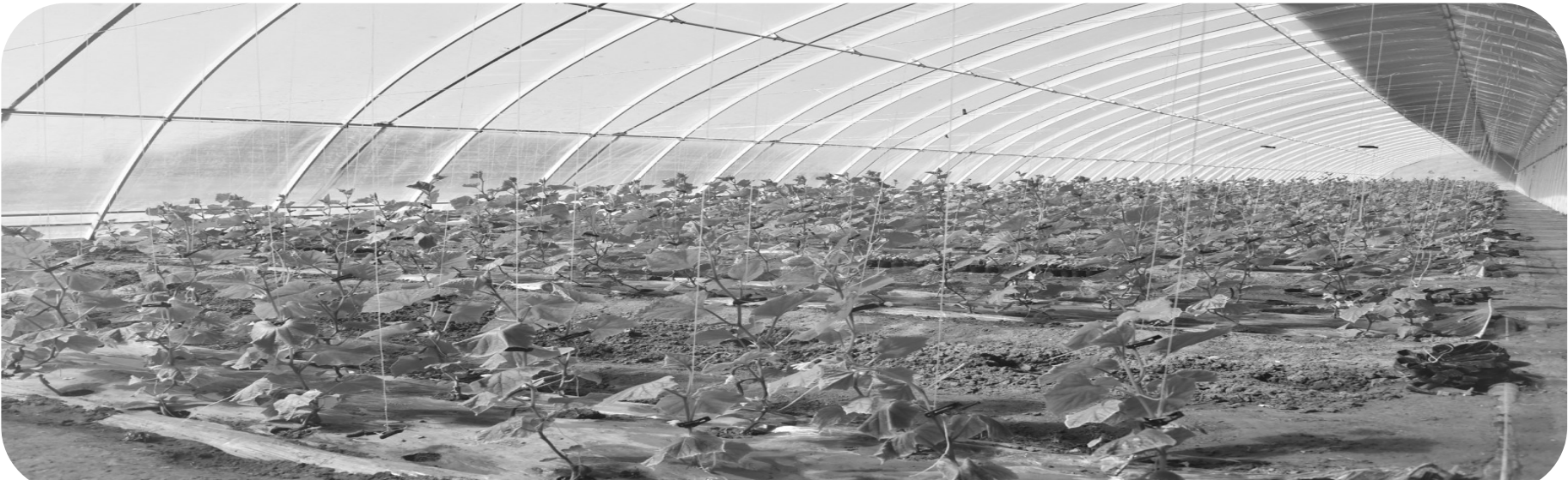
依托蔬菜传统种植和高标准农田建设优势,今年全区新建扶贫温室大棚784栋,完成土地整理1684公顷,经济效益初步显现。图为到保镇蔬菜温室大棚。