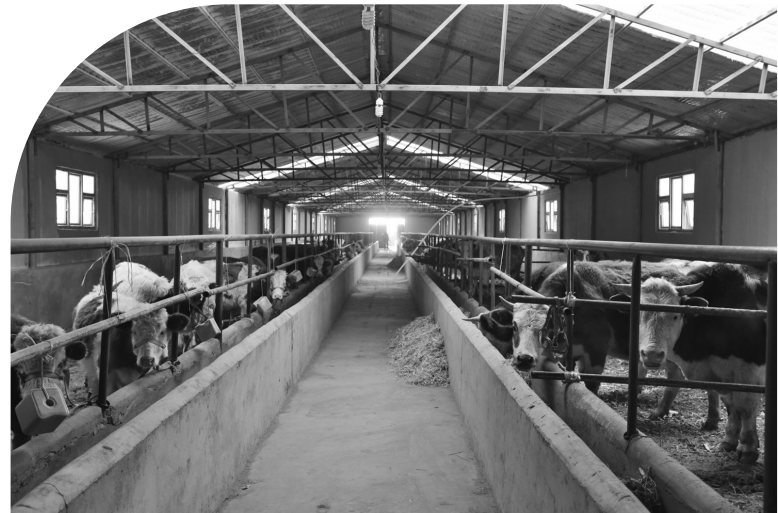
德顺蒙古族乡乌兰村去年在脱贫攻坚工作中投入100万元资金建设肉牛养殖项目,现存栏牛犊36头。今年计划在吉林银行的支持下,购进400头基础母牛,采取分红型扶贫方式帮助该村9户、14名精准扶贫人口全部脱贫。

扶贫事业方兴未艾,致富征程未有穷期。发扬“不到长城非好汉”的精神,鼓起“不破楼兰誓不还”的劲头,洮北区全体党员干部正以良好的精神状态,迈出铿锵有力的步伐,全力以赴打好脱贫攻坚战,确保群众如期实现小康梦。