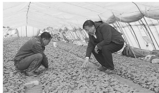
人大常委会副主任卢培林在坦途镇坦途村驻村走访慰问贫困户,并实地察看发展庭院经济情况。