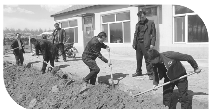
县人社局为哈吐气蒙古族乡宝山村出资5万元帮助贫困户发展庭院经济栽植葡萄。图为驻村干部帮村民挖葡萄沟。