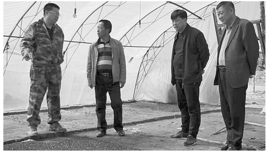
县委书记鲍长山实地踏查镇赉镇架其村庭院经济及产业扶贫情况,并走访慰问贫困户,帮助解决生活中的难题。

在驻村期间,全县各级干部驻村入户,倾听民声、倾情民生,谋项目、办实事,鹤乡大地再次奏响助力脱贫攻坚的强音;他们进农家院,问百姓心事,寻贫困之因,找贫困之源,把贫困之脉,定脱贫之策,各级驻村工作队的真情帮扶,再次形成了全县助力脱贫攻坚的强大合力。