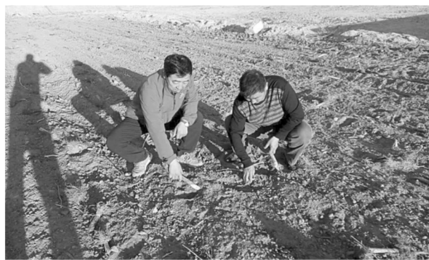
人大常委会副主任唐振友在镇赉镇西乃力村驻村走访慰问贫困户。