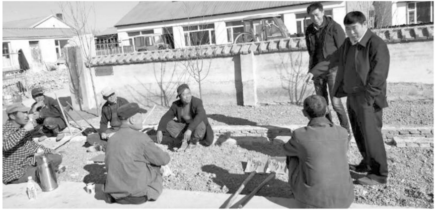
人大常委会主任周定伟实地踏查镇赉镇平乡民生村基础设施项目建设情况。