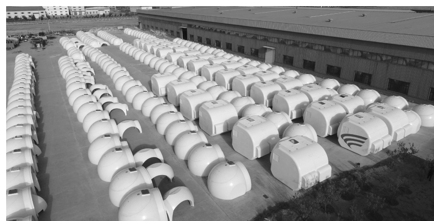
成来电气生产风力发电机舱罩项目。

该县按照“建链、补链、强链”的理念，委托深圳中展咨询公司，围绕资源优势、现有企业上下游产业链延伸，整体包装一批项目。一是谋划产业转型升级、创新、升级项目。重点从工业转型、高新技术、新能源、生物制药、农产品加工、天然气加工等产业以及商贸、物流等现代服务业等谋划项目45项。二是谋划实施完善城市发展格局项目。重点从放大城市格局，建设宜居城市；从加快城市基础设施全面完善，绿色城市建设；从加快老城区棚户区改造、南城区建设等完善城市功能和提高城市品位等谋划项目21项。三是谋划加快推进新农村建设项目。重点从新农村基础设施建设、农业产业化、农产品精深加工、有机食品开发等谋划项目36项。四是谋划加快旅游产业发展项目。重点从哈尔滨等现有景区景点建设，谋划冰雪旅游品牌，开发精品旅游线路，完善旅游配套设施等谋划项目32项。共计谋划项目134项，达到可行性研究报告深度的30项，达到项目建议书的54项，达到项目简介的50项。