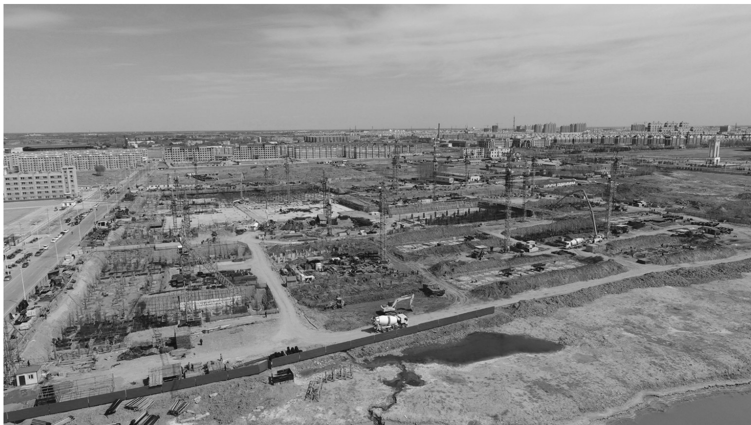
棚户区改造回迁楼建设项目施工现场。