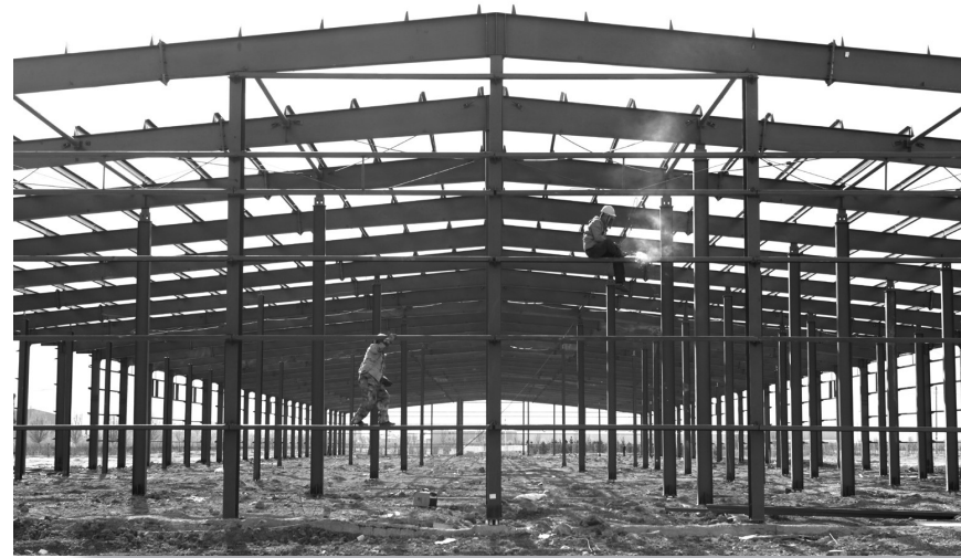
投资10.6亿元的澎派食用植物油有限公司食用植物油综合生产加工一体化项目厂房建设现场。