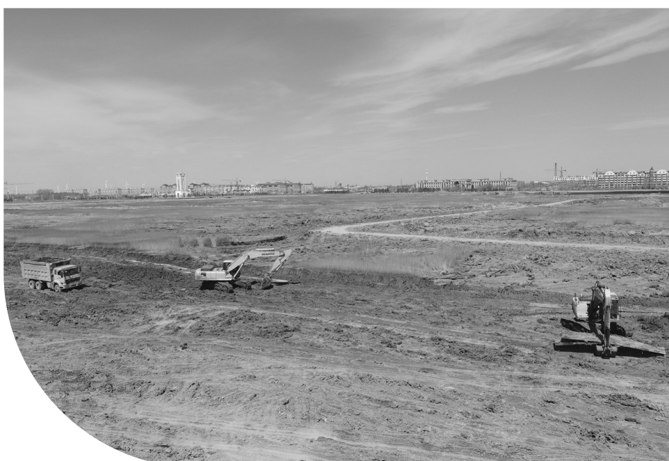
环城国家湿地公园建设项目清淤工程。