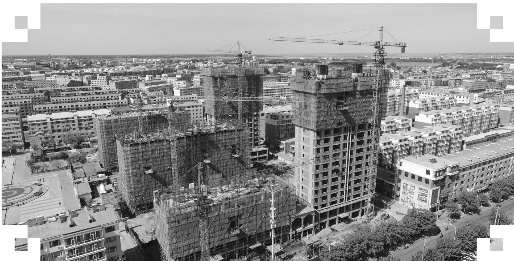
文化花园小区棚户区回迁楼建设项目。