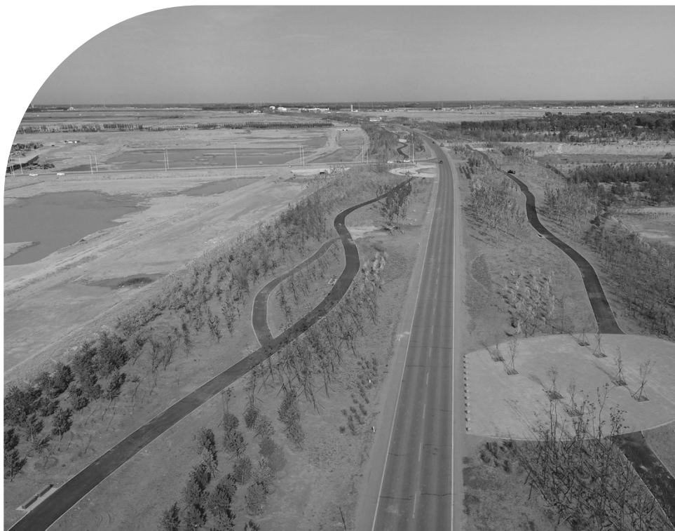
景观大道绿化美化工程。