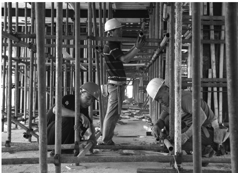
金色家园小区模板支架安装。