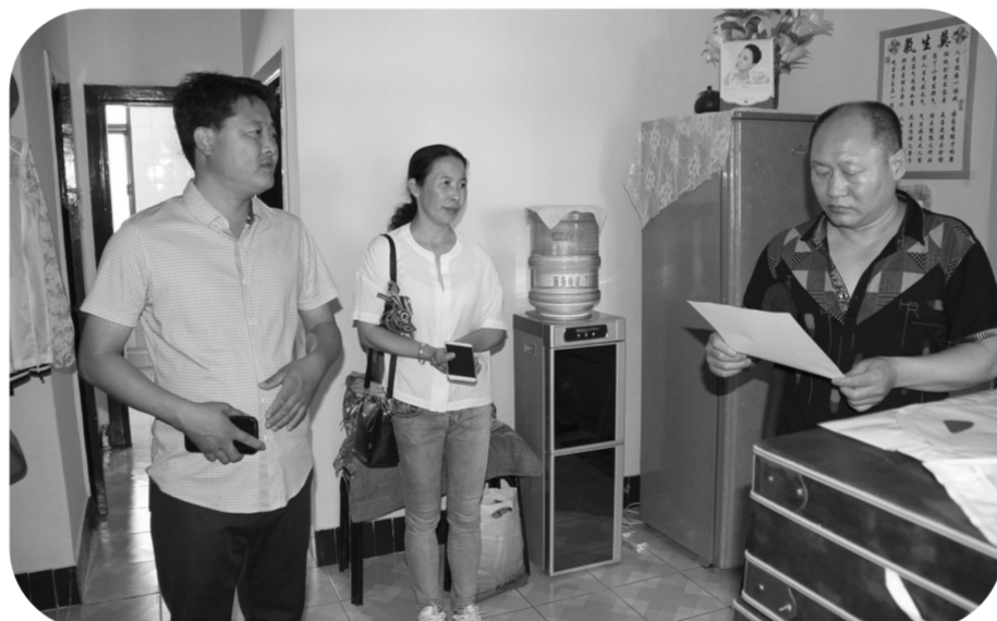
镇赉县广通社区包保工作组工作人员深入群众家中进行拆违动员。