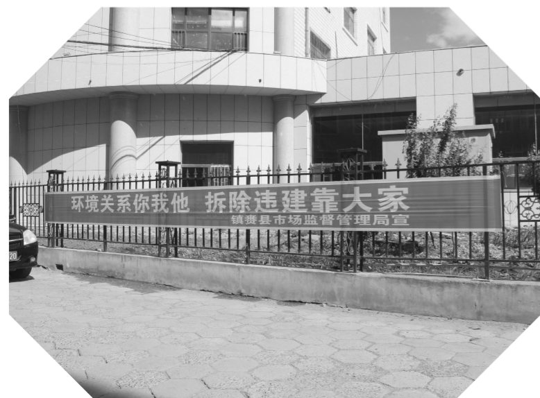
“131”百日攻坚行动中,各包保单位在所负责的辖区内共悬挂宣传标语和条幅157个,营造了良好的舆论氛围。