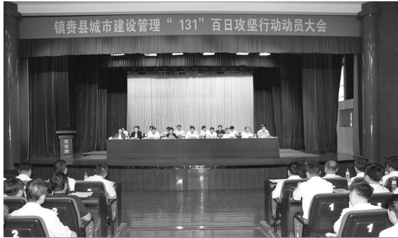
镇赉县委、县政府召开镇赉县城市建设管理“131”百日攻坚行动动员大会。