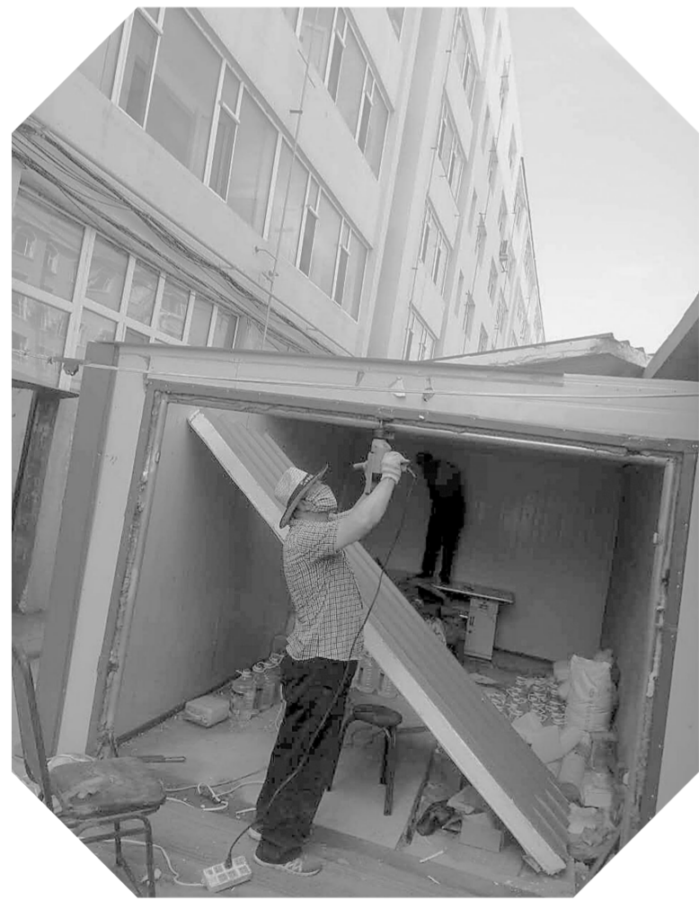
广通社区辖区内的利民小区拆违现场。