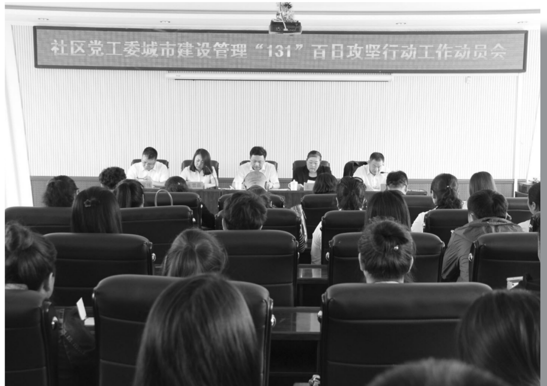
镇赉县社区党工委在庆余社区召开社区党工委城市建设管理“131”百日攻坚行动动员大会。