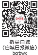
指尖白城 (白城日报微信) bcrbxw