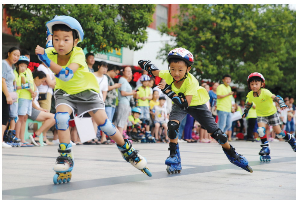
8月19日, 在安徽省淮北市濉溪县, 少儿轮滑爱好者参加速度轮滑追逐赛。当日, 安徽省淮北市濉溪县第八届速度轮滑追逐赛举行, 吸引不少小学生参赛, 体验轮滑运动的速度与快乐。

以青海省海南州为例, 旅游业不再只是一个单独的产业, 以体育赛事为载体, 注入历史文化内涵, 拓展旅游外延, 形成以赛促旅、以旅带文、文体旅共进的新业态, 已经逐渐成为海南州培育壮大特色旅游业的重要途径。