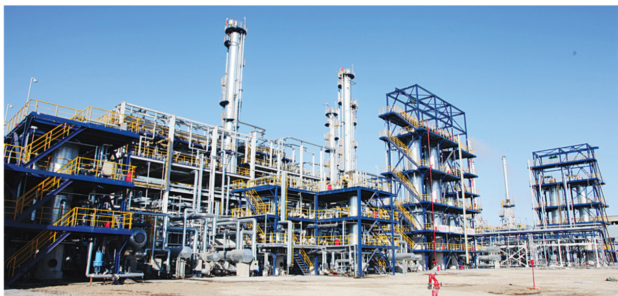
全省10个超百亿元项目基地之一的两家子化工产业园区。