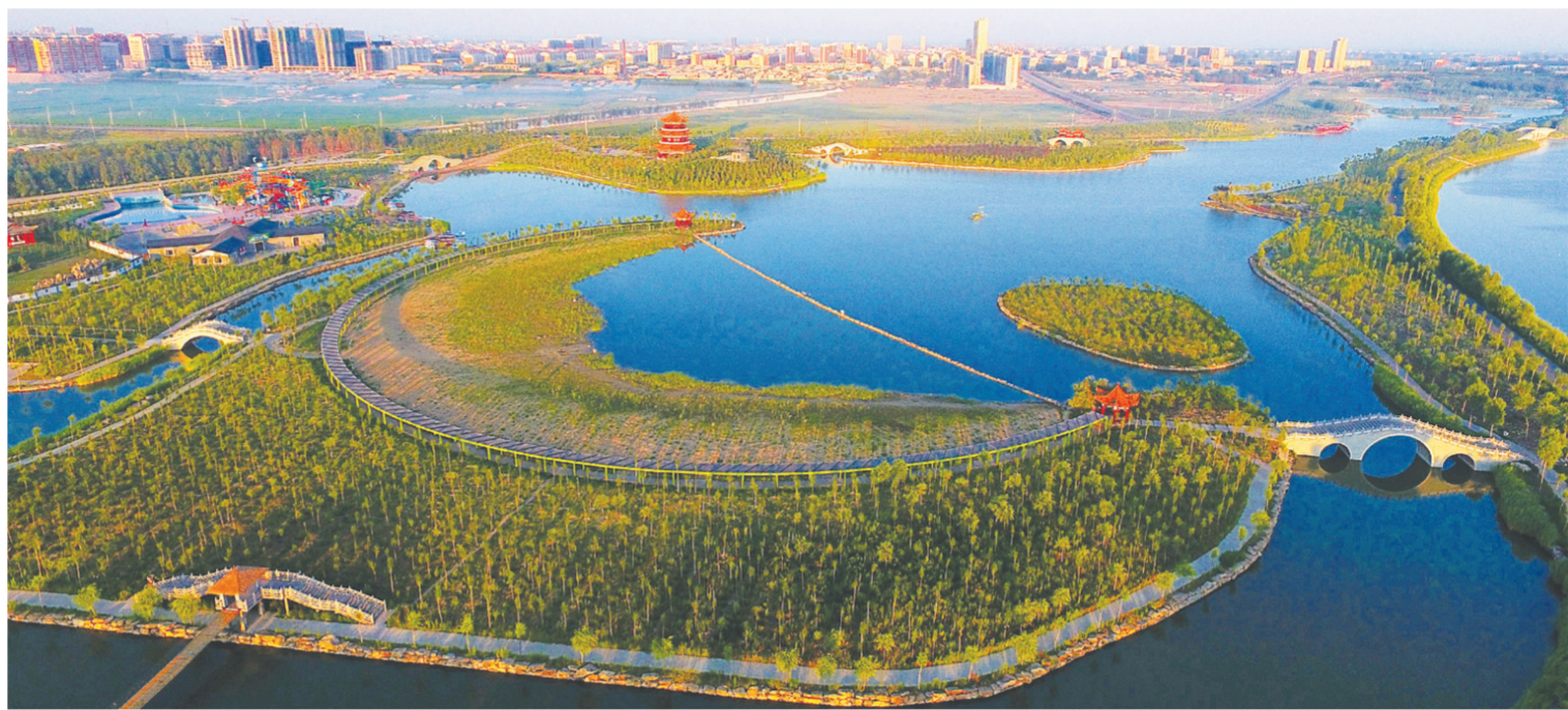
城市建设日新月异,美景如画。