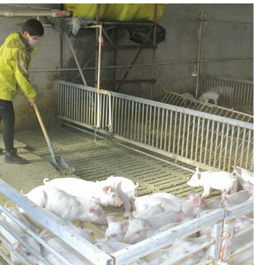
洮北区东胜乡庆生村生态养殖专业合作社成立于去年7月,是村集体创办的扶贫项目,占地面积4100平方米,总投资110万元,主营生猪养殖与购销。该养殖专业合作社采取贫困户入股模式,按比例分为农户分红,2017年该合作社给全村49户贫困户123人每人分红300元。

为全面贯彻党的十九大精神,努力提升广大干部群众法律意识和法律素质,在“12·4”国家宪法日来临之际,我市通过开展“送法进社区”“送法进学校”等一系列丰富多彩的宣传活动,在全市掀起了普法、学法、用法的高潮,收到了良好的社会效果。