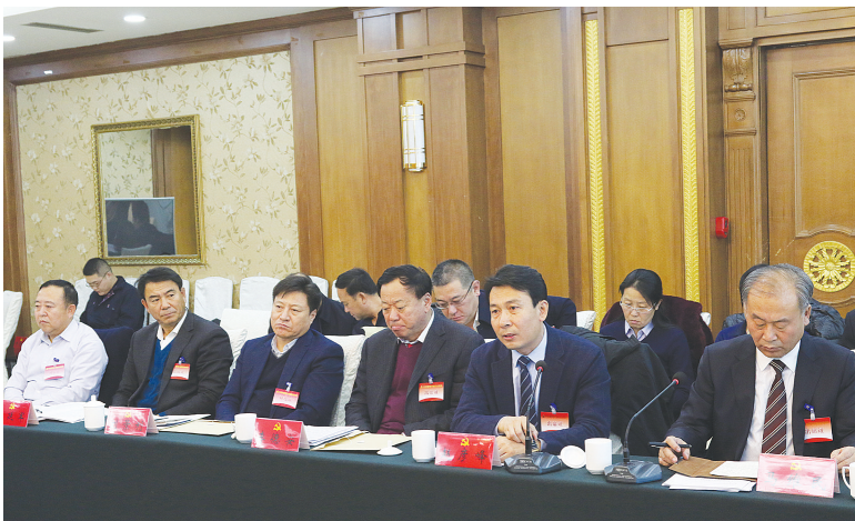
与会的市委委员、候补委员和列席人员结合各自工作实际，从不同角度提出了好的意见和建议。