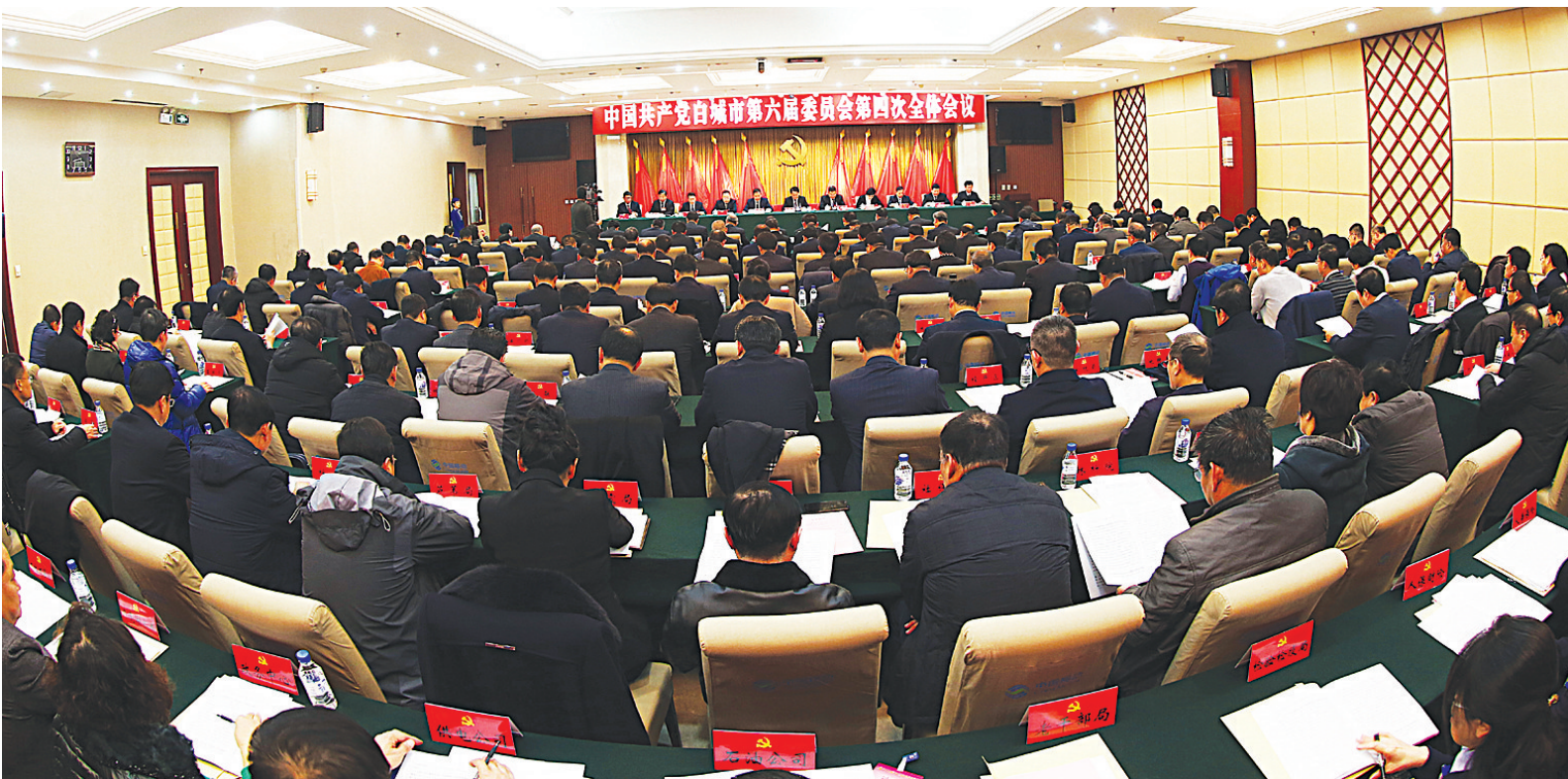
12月11日，中共白城市委六届四次全体会议在白城宾馆召开。

全会深入学习贯彻落实党的十九大精神，听取和讨论了庞庆波受市委常委会委托所作的工作报告，审议通过了《中共白城市委关于高举习近平新时代中国特色社会主义思想伟大旗帜，奋力开创新时代白城全面振兴发展新局面的决定》和全会决议