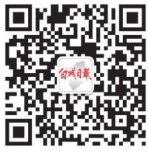
指尖白城 (白城日报微信) bcrbwxx

本报公共电子邮箱：bcrbs0153@vip.163.com 2017年12月12日 星期二 农历丁酉年十月廿五 第10272期