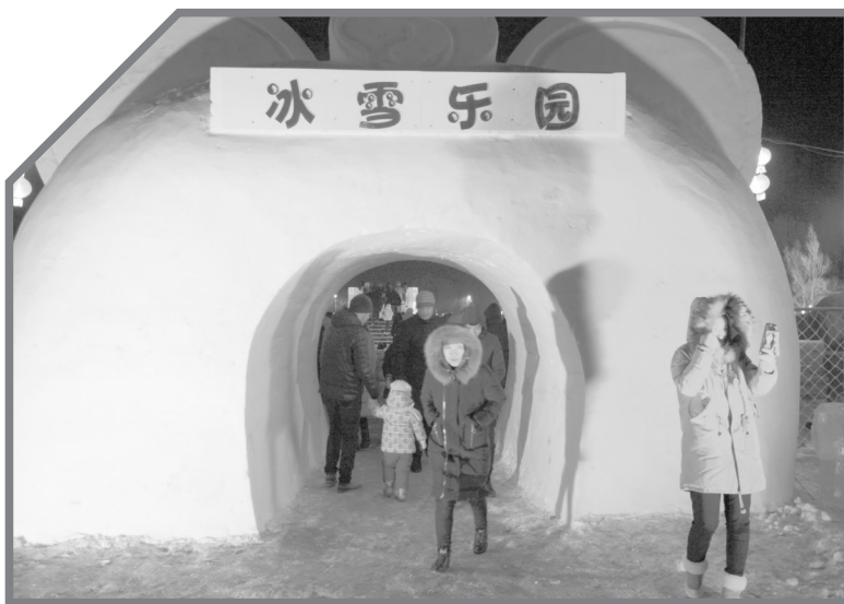
嫩江湾冰雪迪士尼乐园