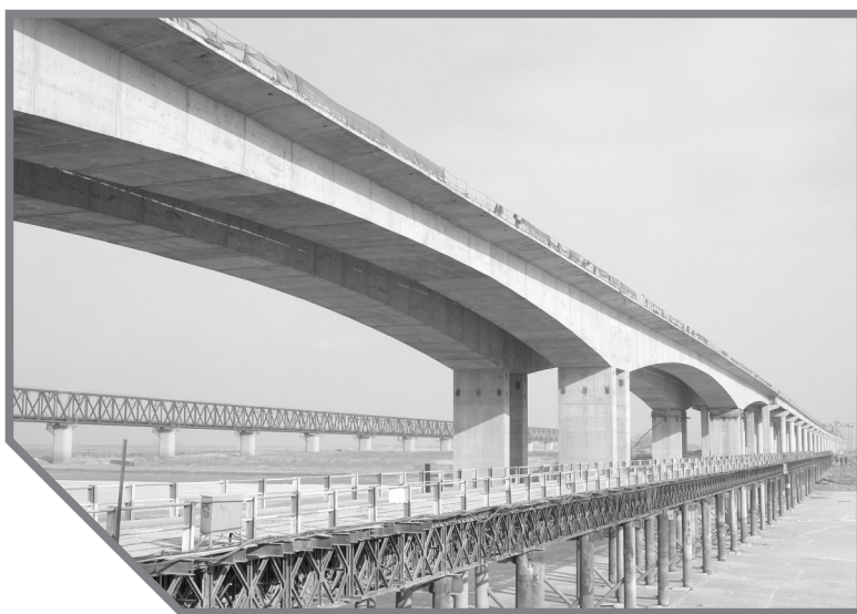
嫩江公路大桥项目