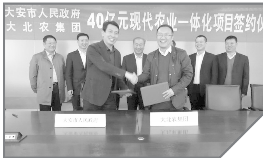
大安史上最大现代农业一体化项目签约

湖平两岸阔,风正一帆悬。站在新的历史起点,迈入新的发展时代,以习近平新时代中国特色社会主义思想为指引,坚持稳中求进工作总基调,坚持新发展理念,在高质量发展之路上驰而不息、奋发有为,未来的大安必将书写恢弘壮阔的发展新篇章。