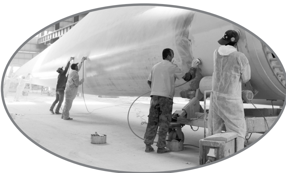
成飞叶片技术开发被列为国家绿色制造类项目