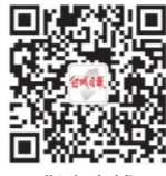
指尖白城 (白城日报微信) bcrbw

本报公共电子邮箱: bcrbs0153@vip.163.com 2018年4月10日 星期二 农历戊戌年二月廿五 第10366期