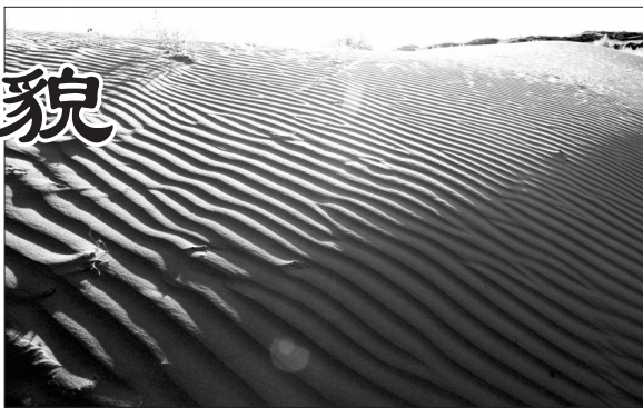
位于洮南市二龙乡的科尔沁沙地

古松辽盆地出现以后,四周的河流均注入盆地之中。这些河流包括今天流经白城的嫩江、洮儿河、霍林河和白城周边的流经通辽市的新开河、西辽河、东辽河及流