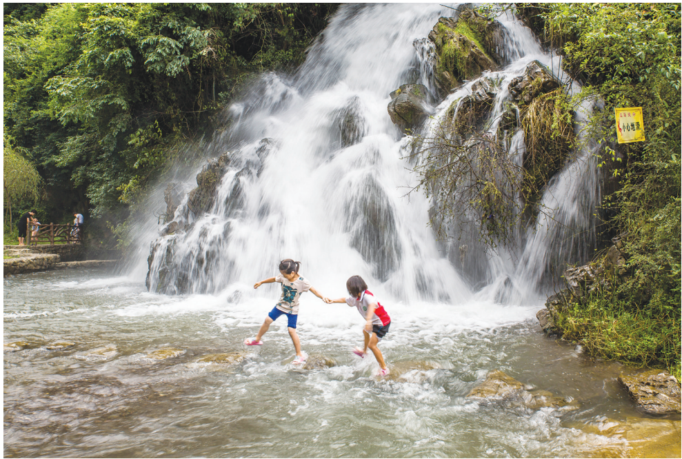
7月11日，在贵州省大方县黄泥塘镇鸟溪生态农业避暑园，小朋友在水边戏水。 贵州省大方县黄泥塘镇依托当地水资源优势，通过土地流转的形式，致富带头人和贫困户共同参与，成立了鸟溪生态农业避暑园，帮助上百名村民在家门口就业，活了资源、美了乡村，更富了当地群众。