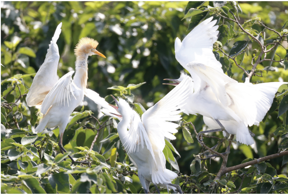
7月11日，在江苏省泗洪县洪泽湖湿地观鸟园，鹭鸟在枝头嬉戏。 近年来，随着江苏泗洪生态环境不断改善，每年夏季数万鸟儿飞抵洪泽湖湿地观鸟园，成为一道靓丽的风景。

极为猖獗，到处笼罩在白色恐怖中，斗争异常尖锐残酷。1月下旬，刚刚建立的市机关即遭敌破坏。1月30日，中共广州市委再次重建，季步高临危受命，担任中共广州市委书记。他想方设法秘密联络、收拢被打散和隐蔽在各处的共产党员和共青团员，恢复和重建党的组织。十几天后市机关再次遭到破坏。季步高早已将个人安危置之度外，在万分险恶的情况下，带领同志们分散隐蔽进行革命斗争。 4月13日，季步高当选为中共广东省委候补委员，并继续在广州开展地下工作。7月，去香港向省委汇报和请示工作时，不幸被港英当局逮捕，遂被引渡回广州反动当局。 在狱中，他受尽了敌人的残酷刑讯和拷打折磨，但他视死如归，始终保持了共产党员宁死不屈的崇高气节。 1928年冬，季步高就义于广州红花岗，牺牲时年仅22岁。