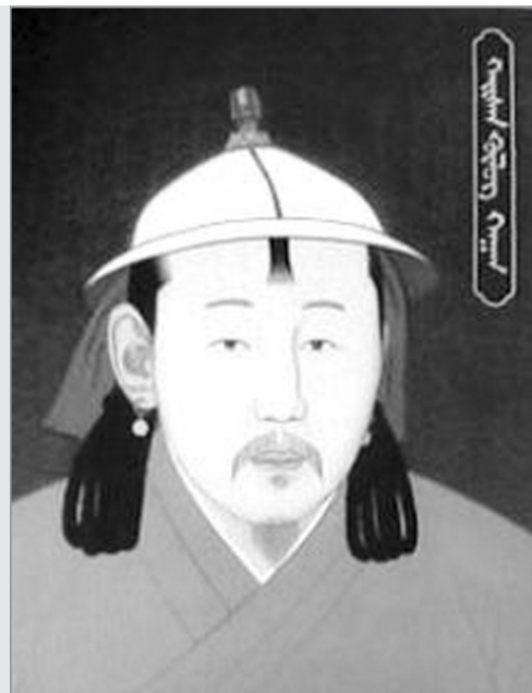
蒙古帝国时期的东道之首帖木格·斡赤斤。