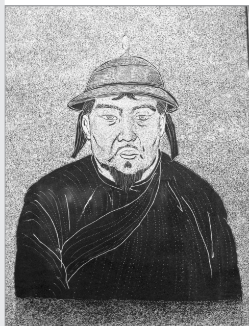
明朝泰宁卫指挥使阿扎失里。

从成吉思汗建立蒙古汗国实行分封制到金王朝灭亡这一时期,今天的白城及周边地区逐渐成为帖木格·斡赤斤及其后裔的领地。这期间活动和管辖这一区域的主要有斡赤斤系蒙古诸王及元朝晚期的助臣泰宁王等。