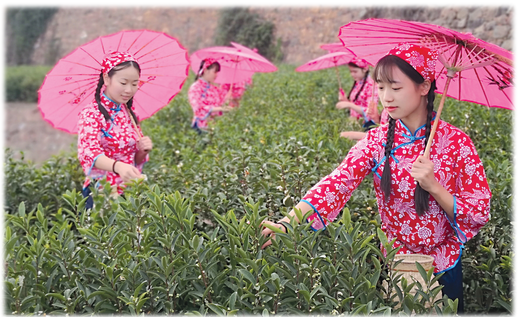
采茶姑娘采收舒茶。