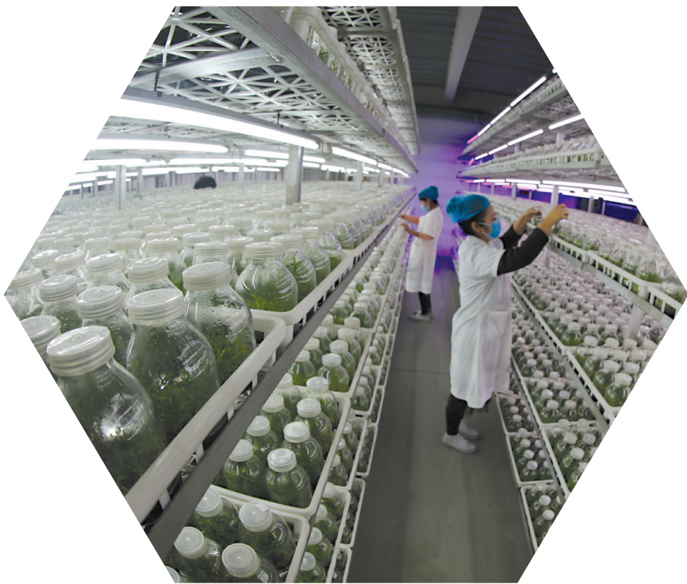
九仙尊霍山石斛股份有限公司。