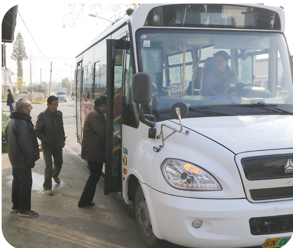
百神庙镇郑圩村“一元钱公交”。