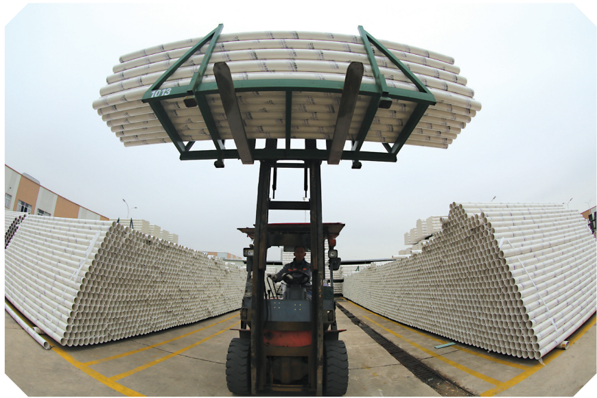
六安中财管道科技有限公司。

当前，六安市以“坚持传承红色基因，推动绿色发展，建设幸福美好新六安”为方向，近年来，围绕“弘扬红色精神，致力绿色振兴，推进新时代幸福六安建设”的战略目标，加快改革发展，推动转型升级，经济社会取得了长足进步，人民幸福指数得到显著提升。