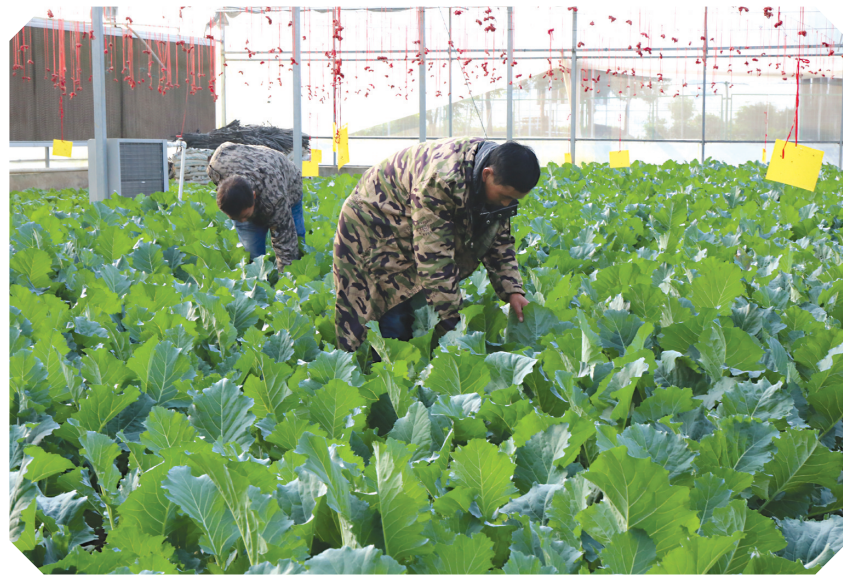
桃溪国家农业科技园。