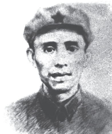
图为邓萍像（资料图片）。

新华社成都电（记者张海森）在距离成都市区约200公里路程的自贡市大安区，一片地势较高的丘陵上，郁郁葱葱的树林掩映着一处故居。这里是红军长征中牺牲的高级将领、革命烈士邓萍的出生地。