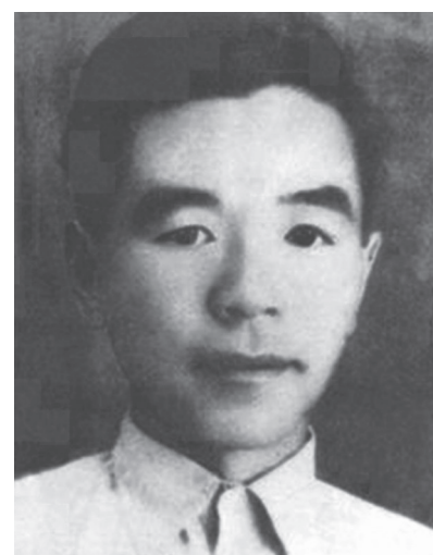
图为罗志像（资料图片）。

新华社广州5月20日电（记者李雄鹰）坐西向东，三间两廊格局，建筑面积216平方米，这便是位于广东佛山高明区杨和镇圆岗村的罗志烈士故居。