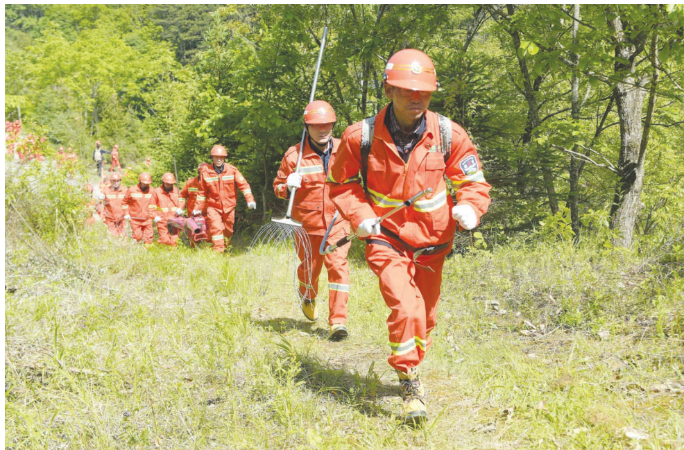
5月21日，消防人员前往“起火地”准备进行“常规装备扑火及开设隔离带”演练。当日，“秦岭林区2019年森林火灾扑救演练”在陕西宁陕县境内的宁东林业局火地塘林场举行。

据介绍，建立疑似职业放贷人名录制度，是为了加强民间借贷案件的审查甄别，防范职业放贷人利用诉讼程序将非法利益合法化。疑似职业放贷人名录仅供人民法院及相关协作单位内部掌握，不对外公示。