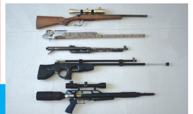
扫黑除恶专项斗争开展以来,县公安局缴获的非法制作枪支。