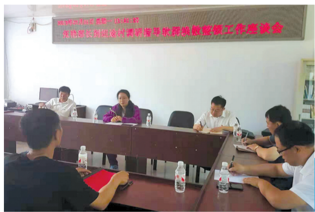
县领导在坦途镇调研指导软弱涣散村整顿工作。