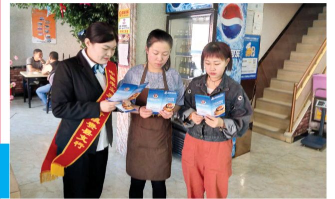
镇赉农发行工作人员入户宣传预防高利贷等非法借贷常识。