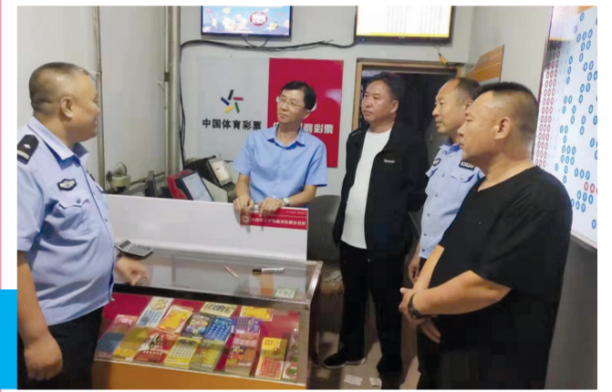
县民政部门开展“黑彩”排查工作。