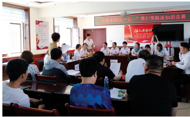
县卫健系统举办七一暨扫黑除恶专项斗争知识竞赛。