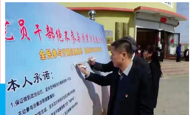
社区党员干部签订“绝不参与涉黑涉恶违法行为”承诺书。