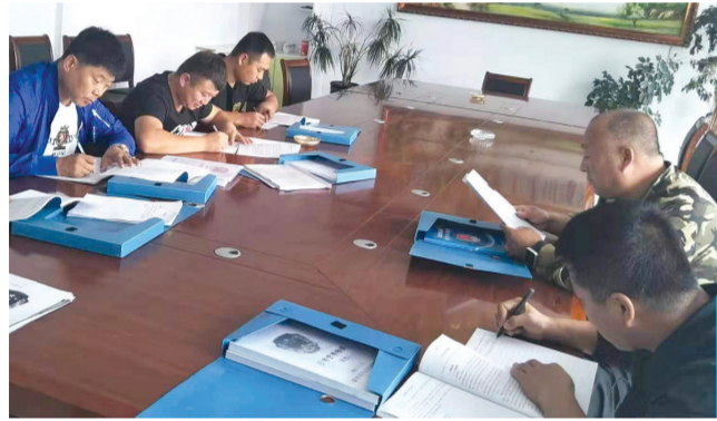
坦途镇社区矫正人员学习扫黑除恶知识。