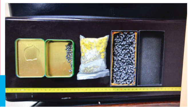
公安部门缴获的非法制作的弹药。