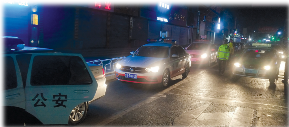
县交通局与交警大队联合开展“黑车”等行业乱象整治。