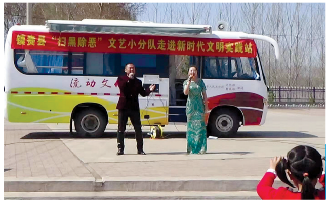
扫黑除恶文艺小分队走进乡村进行宣传。