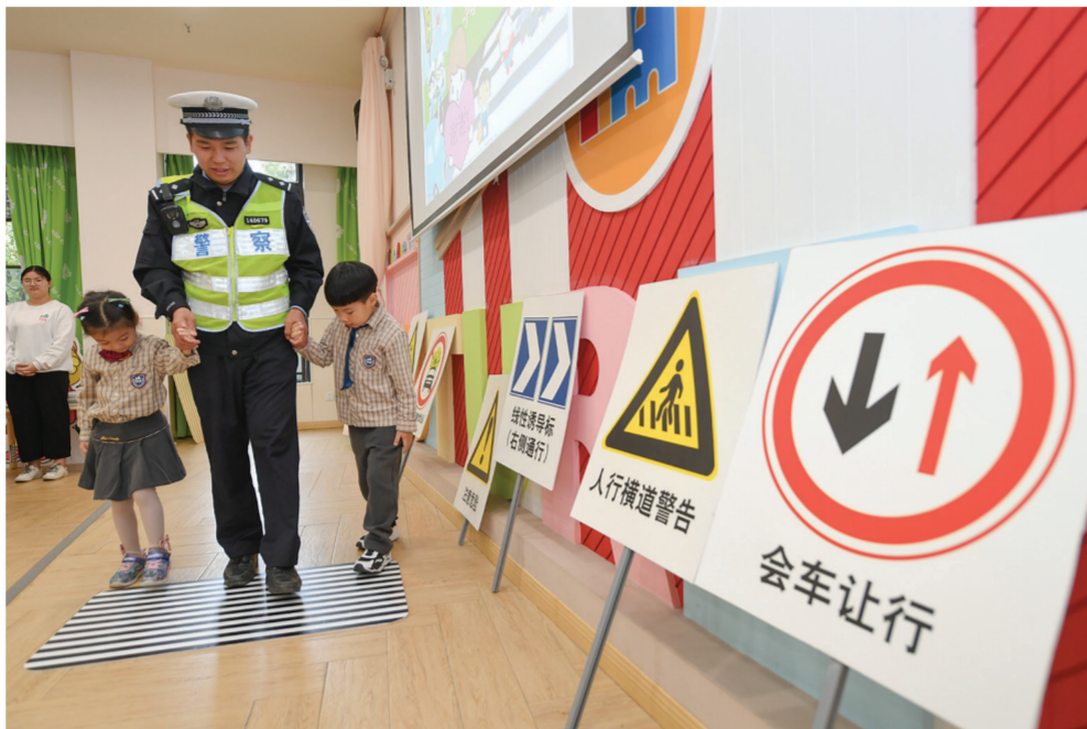
11月26日,福州交警支队晋安大队民警在辖区幼儿园带小朋友玩“过马路”游戏。全国交通安全日前夕,福建福州交警支队抽调警力,走进幼儿园,开展交通安全宣讲活动,提升孩子们的交通安全意识。

新华社银川11月26日电(记者邹欣媛 范思翔)记者近日从宁夏回族自治区人力资源和社会保障厅了解到,宁夏今年持续推进一系列就业政策举措,截至10月底,全区建档立卡贫困劳动力实现转移就业3.31万人,其中,未脱贫建档立卡贫困劳动力实现转移就业1.22万人。 宁夏今年多渠道开发就业岗位促进就近就地就近转移就业,扩增就业扶贫示范基地,加大劳务经纪人培训力度,吸纳、带动建档立卡贫困劳动力就业;开发购买建档立卡专项公益性岗位,帮助特别困难的建档立卡贫困劳动力就业。 同时,为缓解农村劳动力创业融资难,宁夏推行“创业贷款+扶贫贷款”“两户至五户联保”等模式,降低农村劳动力申请创业担保贷款门槛。截至今年10月底,宁夏为建档立卡贫困劳动力发放创业担保贷款369笔、3101万元,为返乡农民工发放创业担保贷款184笔、1960.5万元。 另外,宁夏加强与福建、江苏、浙江、内蒙古等省区的劳务协作,特别是推动福建省出台赴闽就业政策,将宁夏建档立卡贫困家庭劳动力纳入福建就业困难人员援助对象范围;组织闽宁劳务协作座谈会、专场招聘会、职业技能培训等,为1.38万名建档立卡贫困人员提供就业服务。