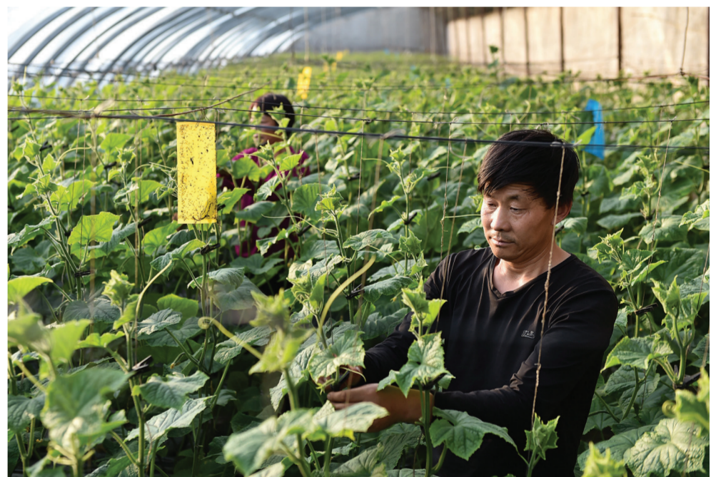
11月26日,村民们在河北省平泉市桦树社区蔬菜园区温室大棚内护理黄瓜秧。随着冬季的到来,河北省平泉市气温逐渐走低。农户在当地农业园区的温室大棚内从事“菌菜果”特色产业,使寒冷的冬季不再是农闲的季节,实现稳定增收。近年来,平泉市在全市脱贫摘帽后扶持力度不减,按照“南果北菜全域菌”的发展布局,围绕设施农业在全市建成各类农业园区9万亩,帮助当地群众稳定致富。