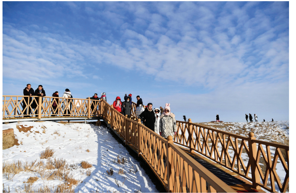
11月26日,来自全国百家旅行社的旅游业界人士在新疆福海县乌伦古湖海上魔鬼城景区参观。福海县乌伦古湖海上魔鬼城景区位于新疆阿勒泰地区福海县吉力湖东岸,有着独特的雅丹地貌和水域景观,是当地著名的旅游胜地。