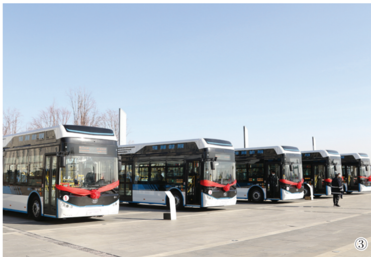
图①出席仪式的领导共同按下氢燃料电池公交车投运启动键。 图②参加仪式的人员试乘氢燃料电池公交车绕鹤鸣湖环行一周。 图③15辆氢燃料电池公交车“整装待发”。