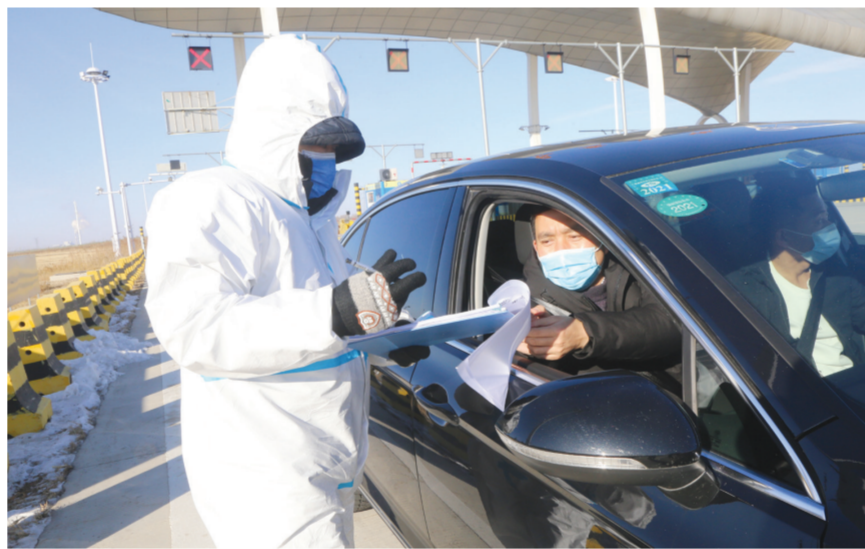
图为白城长安机场疫情防控检查站的工作人员对过往车辆(人员)进行检查。

1月27日一大早,凛冽的寒风中,白城长安机场疫情防控检查站的工作人员在穿好防护服,做好全身消毒后,开始了一天的工作。 在检查站入口处,工作人员对去往白城长安机场方向的车辆进行检查并核对乘车人员信息,做好信息登记,对(返)白车辆(人员)查验健康码、行程码和核酸检测报告,并做好测温等工作。每一项工作都认真有序地进行,尽管工作人员的双腿已站得僵硬,双手已被冻得失去了知觉,但他们依然奋战坚守,全力确保我市外防输入工作落到实处。