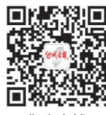
指尖白城 (白城日报微信) bcrbw