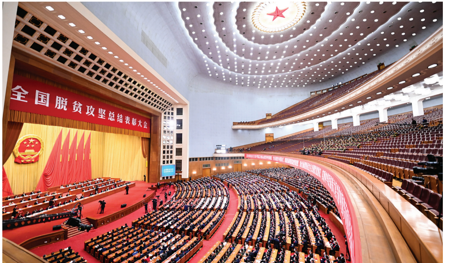
2月25日,全国脱贫攻坚总结表彰大会在北京人民大会堂隆重举行。