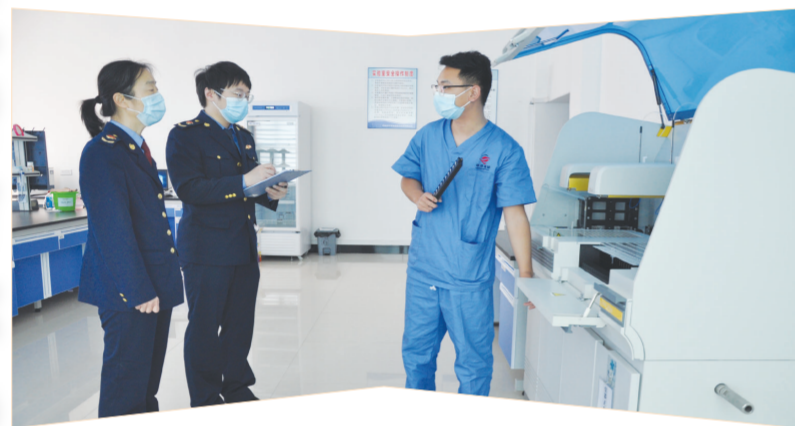
市监局工作人员深入核酸检测机构现场办公。

了解。部分企业代表就生产经营过程中遇到的问题和诉求进行了发言,相关的责任监管部门现场进行了答疑解惑。此次“服务企业周”主题系列活动,为优化企业公平竞争市场环境,进一步放开企业市场准入,给企业发展创造了充足的市场空间。