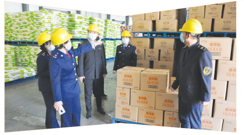
市监局工作人员深入企业帮助指导工作。