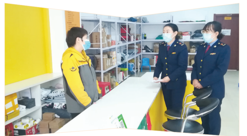
市监局工作人员深入快递企业了解消费者投诉情况。