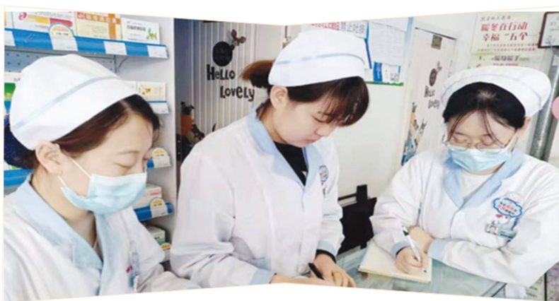
市监局通过线上宣传,加强对《医疗器械监督管理条例》的贯彻执行工作。