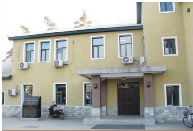
中共辽吉省委办公旧址