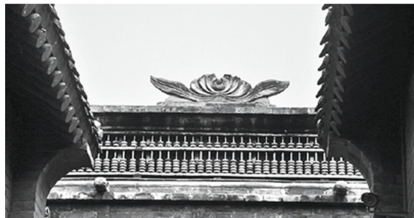
康百万庄园钱庄门头上,镶嵌着一架长久算盘。算盘上头,雕立着一株莲花。

在河南省巩义市康百万庄园钱庄房区钱庄门头上,镶嵌着一架长久算盘,长9.99米,有99根柱子。算盘上头,雕立着一株叶展蕊放的莲花。