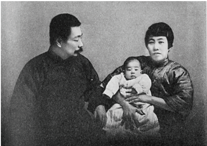
鲁迅、许广平与周海婴的全家福。

林则徐说：“子孙若如我，留钱做什么？贤而多财，则损其志；子孙不如我，留钱做什么？愚而多财，益增其过。”在朝报国，在家教子，林氏家风严正，其后代在不同领域有所建树。林则徐不曾考虑个人得失，他愿为家国天下付出所有，这些楹联正是其赤诚心声，久久回响。