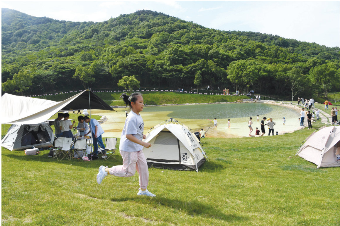
5月26日，在定海区东海百里文廊沿线的白泉镇觅林古树园，小朋友在奔跑玩耍。 5月25日，浙江省舟山市定海区的东海百里文廊迎来正式开通一周年。一年来，东海百里文廊吸引了超过230万人次的游客到访，沿线建成共富工坊70家，助农增收近千万元。长100.5公里的东海百里文廊串联起8个镇（街道）的200余个景观点，深度融合定海的历史、文化、生态和乡村美景。

习近平总书记指出“注重从就业、增收、入学、就医、住房、办事、托幼养老以及生命财产安全等老百姓急难愁盼中找