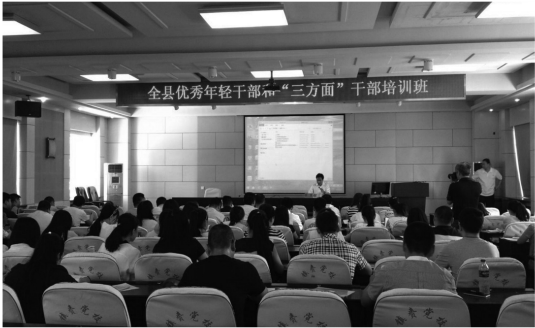
为认真贯彻落实习近平总书记系列讲话精神,提升镇赉县年轻干部的综合素质和实践能力,近日,镇赉县举办全县优秀年轻干部培训班,共89人参加,主要采取集中授课、分组讨论、综合实践等方式,对习近平总书记系列讲话精神、理想信念理论知识、党的纪律建设以及作风和团队意识等方面进行深刻学习讨论。图为培训现场,该县党校教师正在为学员们讲授理论知识。

本报讯(李文广)镇赉西瓜远近闻名。自西瓜进入销售旺季后,为了保护瓜农和贩瓜客商安全,确保贩运和贩卖中道路畅通,连日来,镇赉交警大队从实际出发,采取多项措施,规范西瓜市场秩序,为瓜农和贩瓜客商开辟绿色通道。 工作中,所有民警在执勤执法中对贩运西瓜的车辆一律只纠正,不罚款,对轻微的超载行为不卸载,防止因卸载导致西瓜破损,损害瓜农和客商利益。进入西瓜销售旺季后,瓜农在207省道、镇(镇赉镇)——嘎(嘎什根)公路占道贩卖西瓜的现象较为突出。由于西瓜摆放占据了有效路面致使车辆行驶不畅,该队组织民警采取召开瓜农安全宣传会,分发宣传资料等形式加强安全宣传,并出动巡逻车,加强对这里交通巡逻,重点纠正占道贩卖西瓜的行为。对占道行为坚决取缔,劝说瓜农将西瓜退至路下,既保证道路畅通,又保证了自身安全。傍晚时,部分瓜农将西瓜运至城区街路等宽敞居民聚居点叫卖,市民大多出门散步纳凉,为了便于瓜农销售,又方便市民买到新鲜价廉的西瓜,城区一中队、二中队出动巡逻车在这些地段进行交通维护,允许瓜农在广场等开阔地贩卖西瓜,但不能占据主要路口,对前来购瓜的群众和车辆,交警通过喊话宣传提醒注意交通安全,防止发生交通事故。