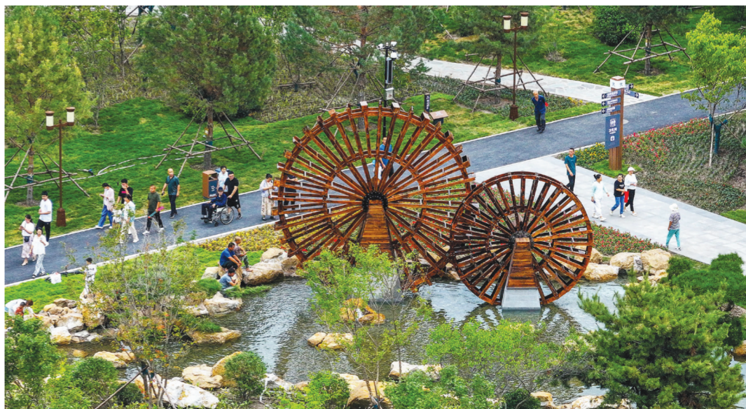
公园将水循环设施与文化景观相结合,打造风格多样的水主题景观,吸引市民驻足观赏。