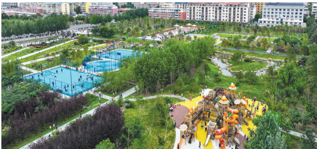
公园设施配备齐全,满足不同年龄层次市民的运动需求。