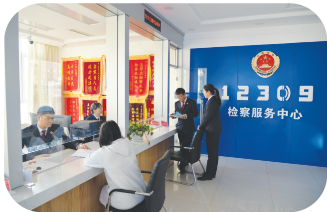
镇赉县人民检察院检务督察部门与政治部联合行动,在全院范围内针对机关安保、警车管理等工作进行全面细致检查。

本报讯(记者孙泓轩 王娅楠)春节前夕,为营造风清气正的节日氛围,镇赉县人民检察院检务督察部门与政治部联合行动,在全院范围内开展了节前专项检务督察工作。