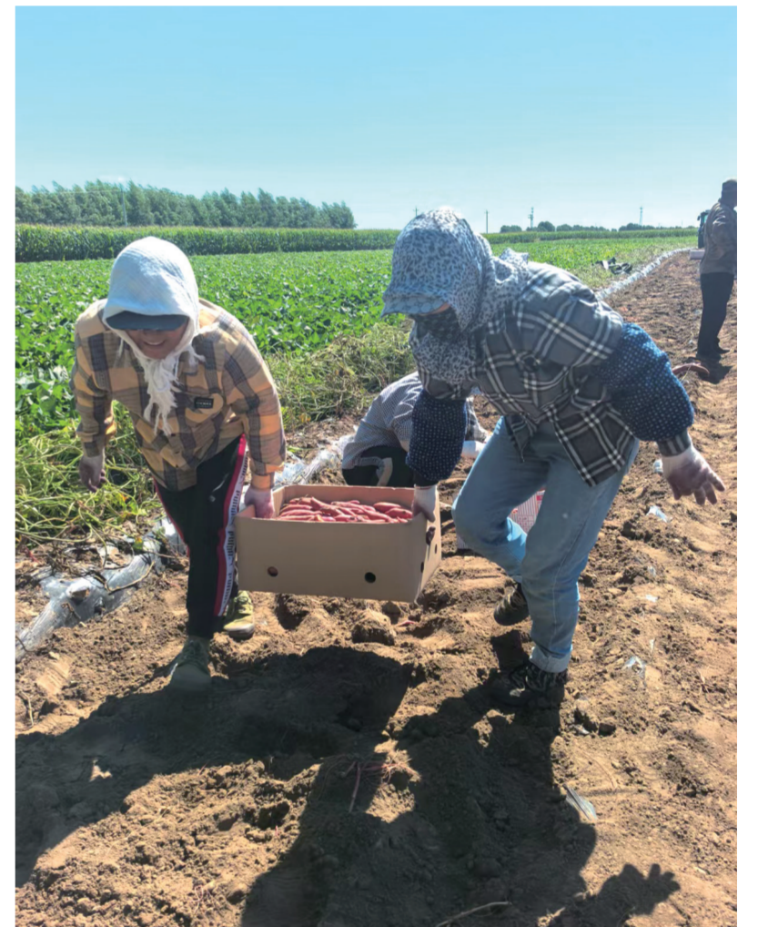
近年来,洮北区林海镇立足本地实际,发展特色农业,种植的地瓜、辣椒、姑娘深受市场欢迎。因为地瓜喜获丰收。