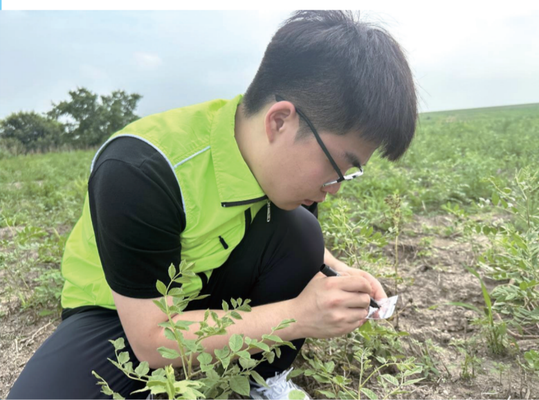
科源团队人员观察记录道地药材生长情况。

在洮北区、镇赉县等种植基地试用后,环保育苗基质表现卓越。种植户普遍反映,药苗苗齐苗壮、根系发达、抗逆性强,移栽成活率高,极大增强了种植信心。科源团队的这一创新,是职业教育服务地方经济、助力“三农”发展的生动实践。该团队负责人表示,将持续优化技术,加大推广力度,让更多种植户受益,为谱写白城现代化中药种植产业新篇章贡献职教智慧与力量。